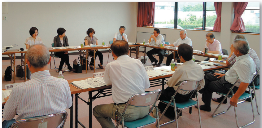
●研究会の会議風景（和地市民館）

10月22日（月）に開催した定例理事会では、第二テーマ「 地域活動の活性化 」について、「 地域団体活性化 」「 女性参加の拡大 」の調査・研究結果を報告しました。現在も「地域コミュニティと神社活動の関係整理・活用」について検討しています。