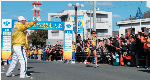
●トヨタ自動車チームのゴールシーン（セントファール付近）

田 原市で初の開催となるこの大会は、 連合会も後援し、各校区から424名がボランティア として走路補助員を務め、ランナーや観客の安全、そして大会の成功に貢献しました。（全体のボランティア数は公募含め約1200名）