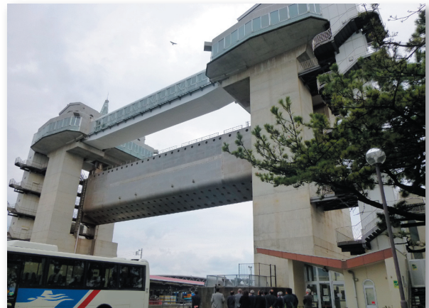
●沼津港の津波侵入防止水門「びゅうお」（沼津市・我入道）