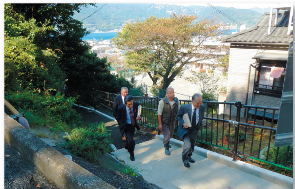
●擁壁に整備された津波避難路（熱海市・網代）